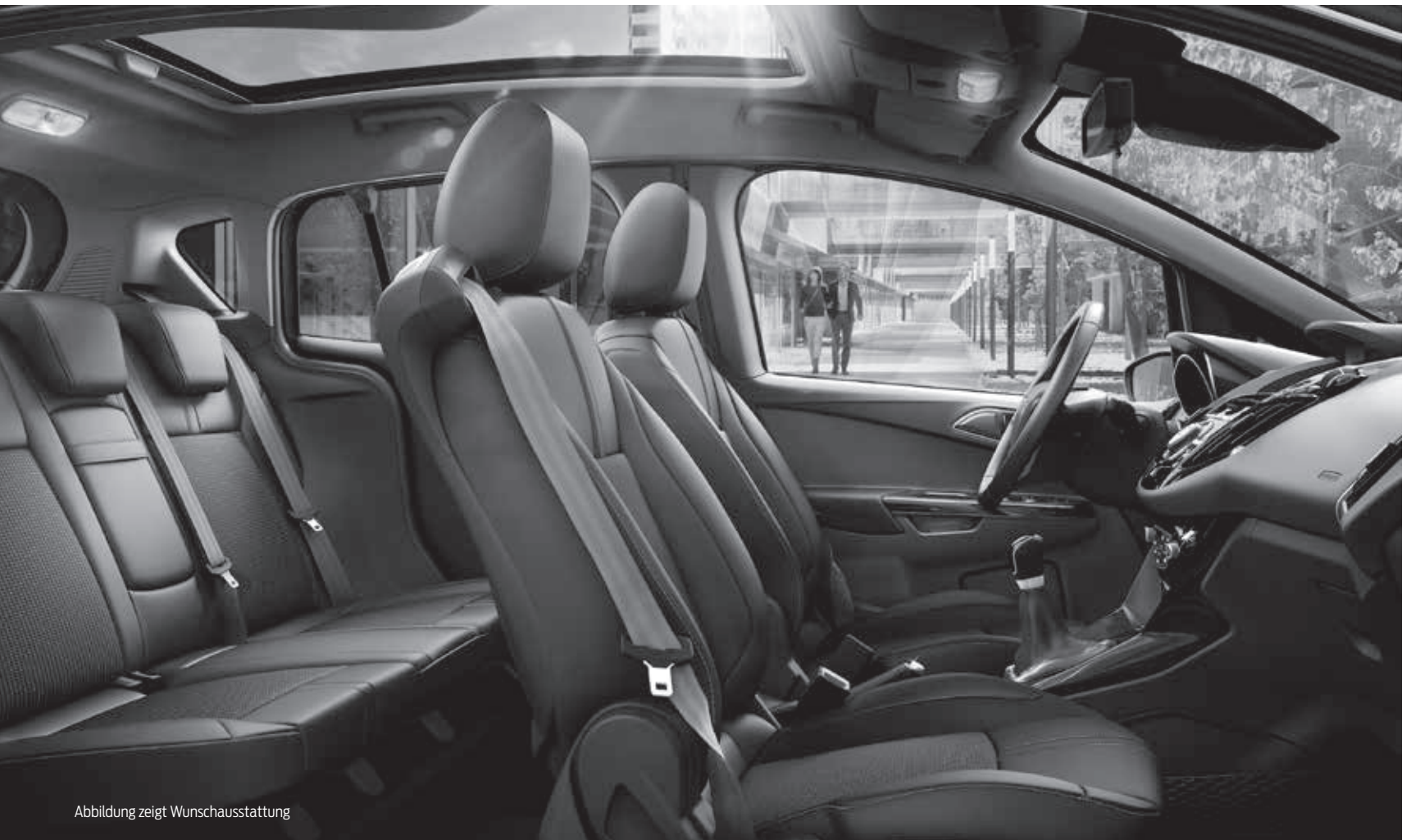
Abbildung zeigt Wunschausstattung