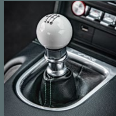
Schaltknäuf im Bullitt TM -Design