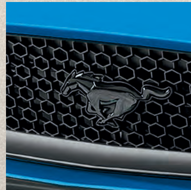
Mustang-Pony in Schwarz