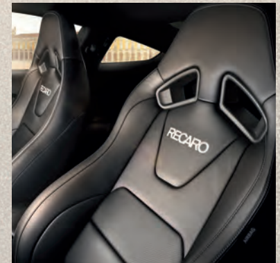
Recaro-Sportsitze vorn in Leder-Optik (optional)