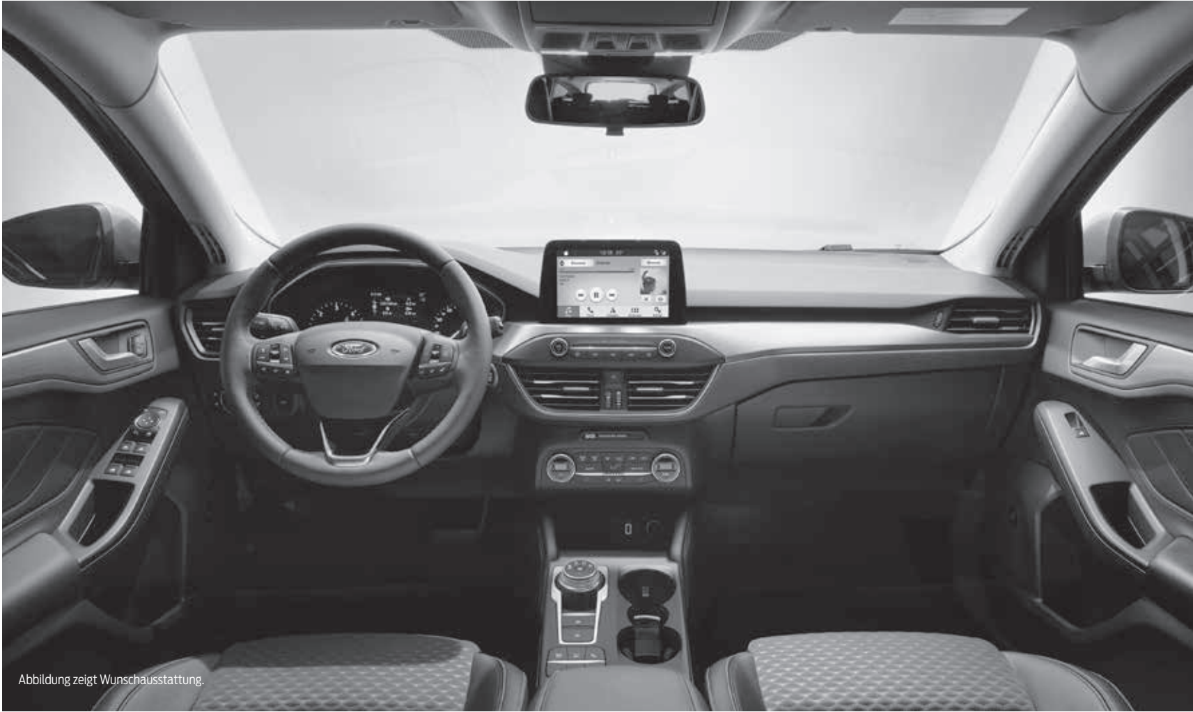
Abbildung zeigt Wunschausstattung.