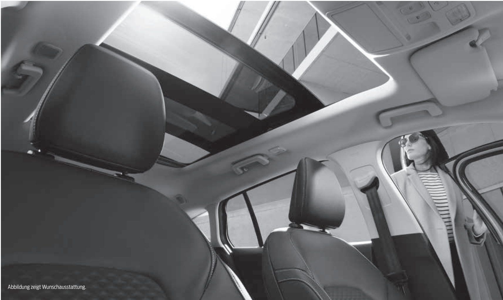
Abbildung zeigt Wunschausstattung.