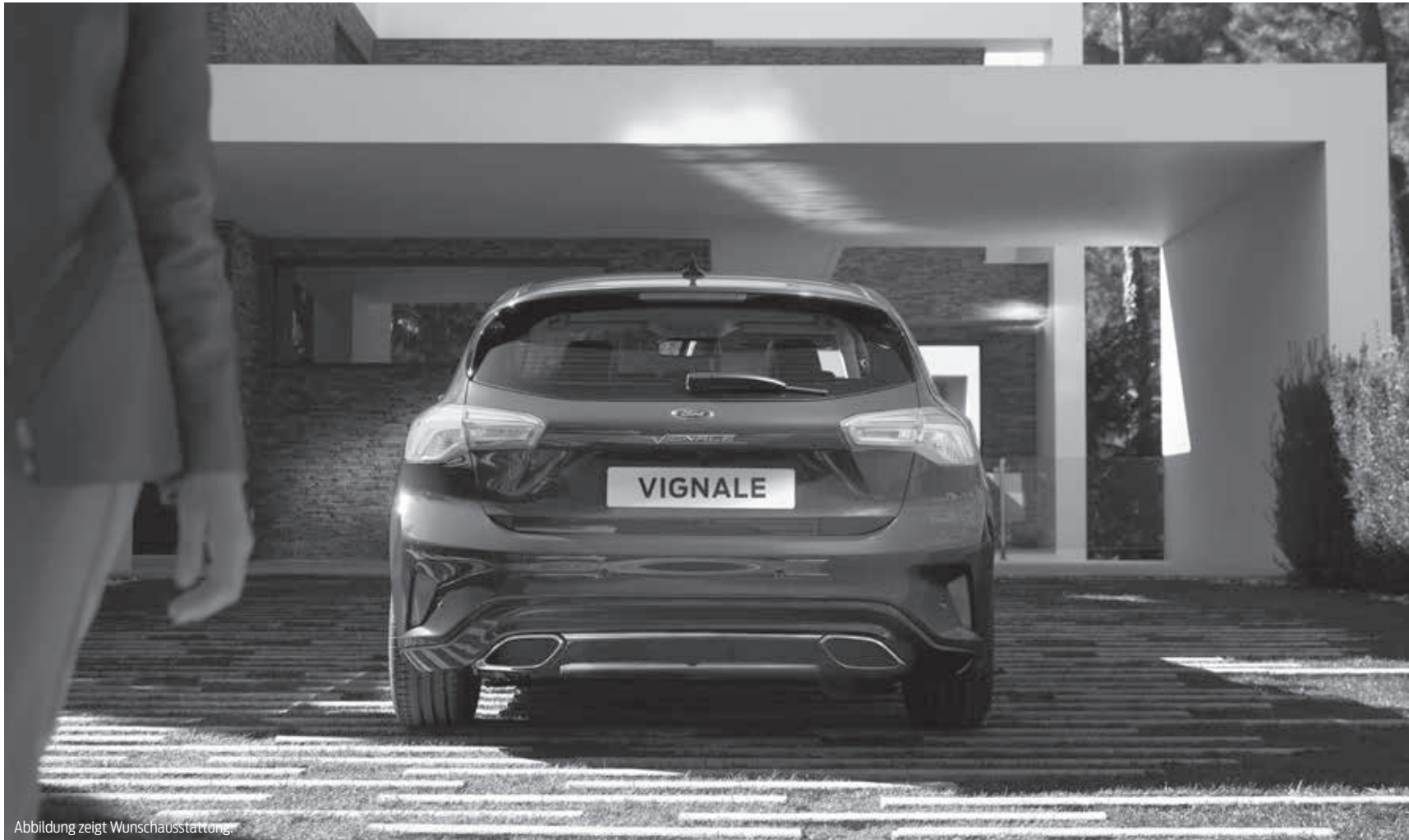
Abbildung zeigt Wunschausstattung.