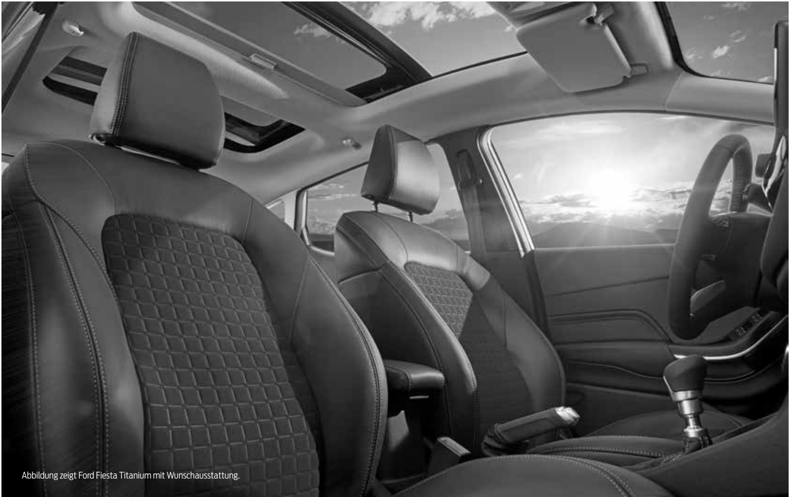
Abbildung zeigt Ford Fiesta Titanium mit Wunschausstattung.